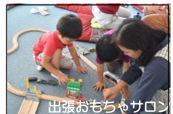
出張おもちゃサロン