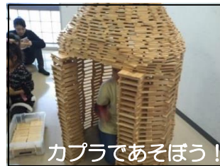
カプラであそぼう！